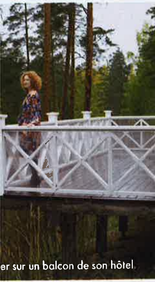
er sur un balcon de son hôtel