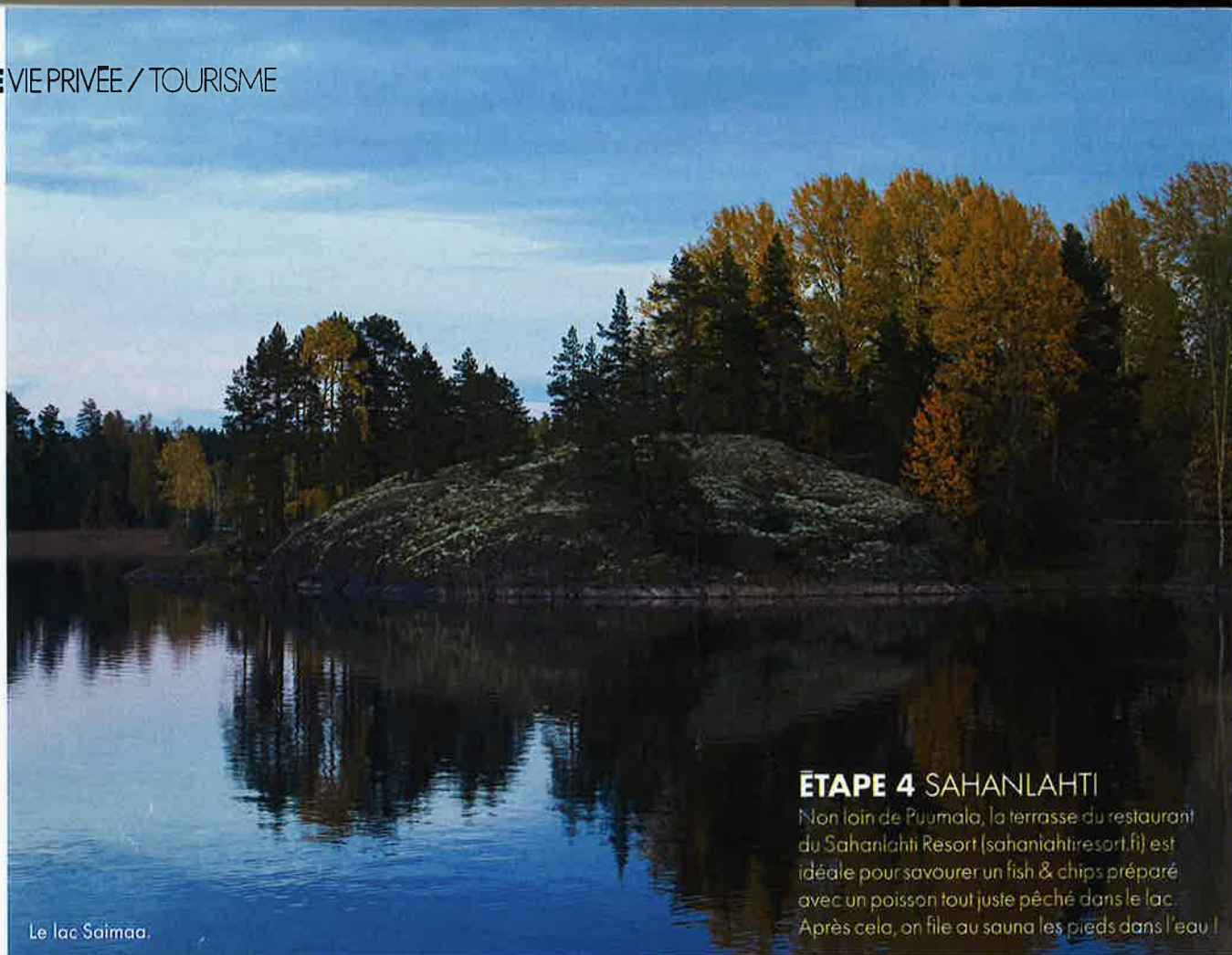
Le lac Saimaa.