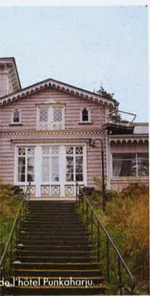
de l'hôtel Punkaharju.