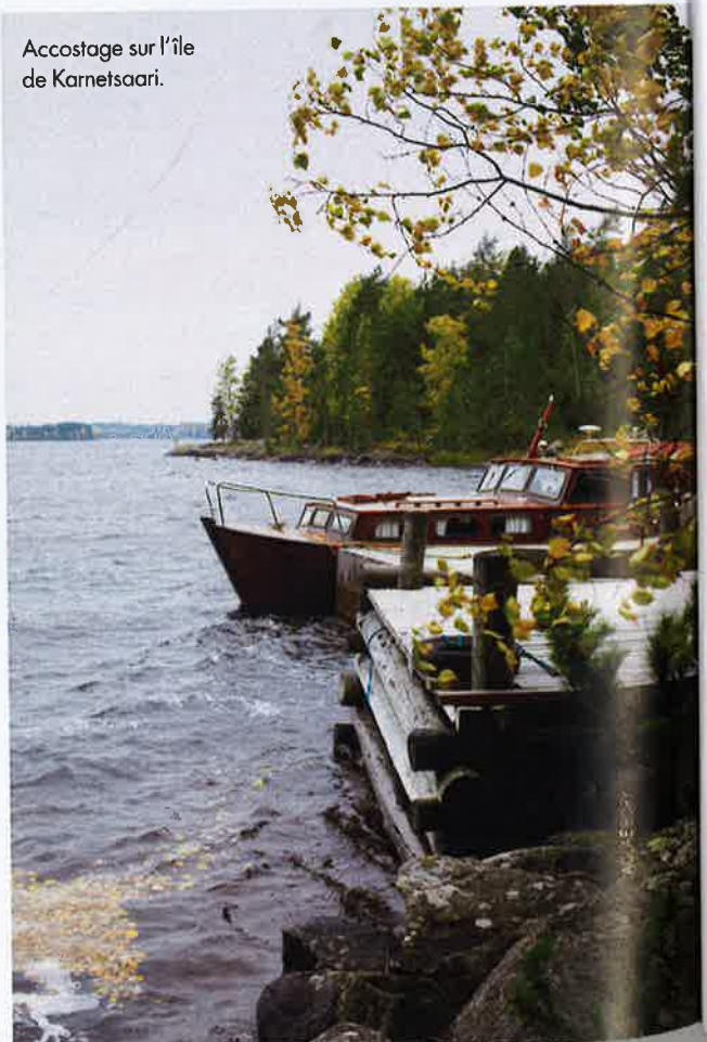
Accostage sur l'île de Karnetsaari.

Rantasalmi, à 1 heure de route de Mikkeli, est une petite ville perdue au milieu de la forêt. Au nord, la réserve de Porokylä ( porokyla.com/en ) accueille été comme hiver quelques rennes descendus du Grand Nord, pour la plus grande joie des touristes ! Pour y aller, on attend son guide à la réception de l'Hotel & Spa Resort Järvisydän ( jarvisydän.com ).