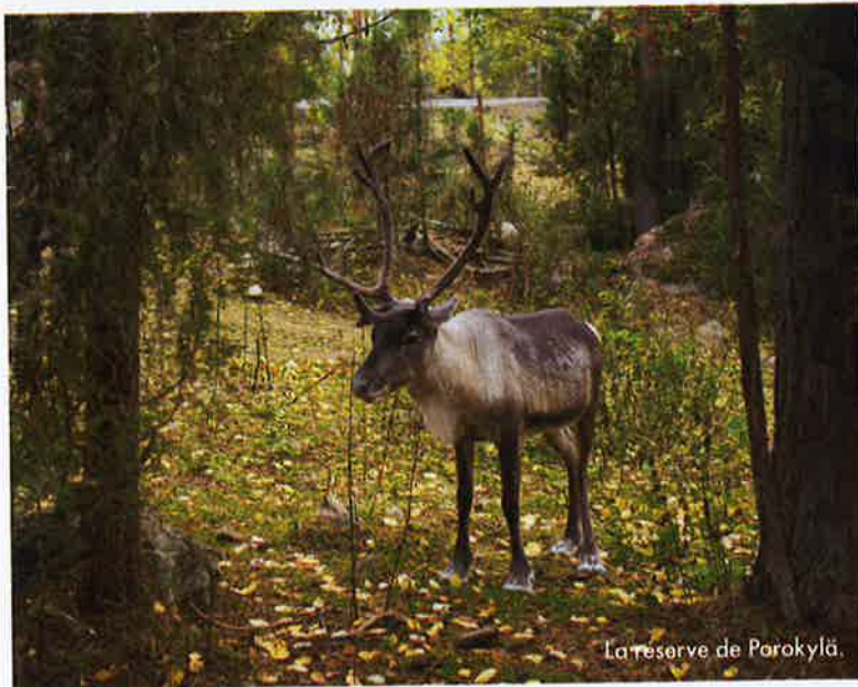
La réserve de Porokylä.