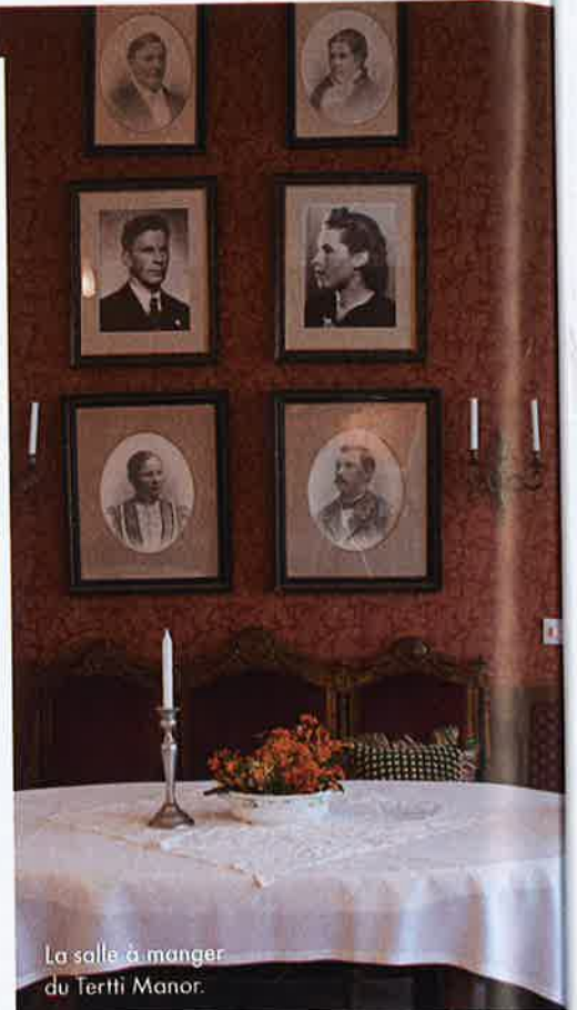
La salle à manger du Tertti Manor.

À deux heures d'Helsinki, Mikkeli est une petite ville au milieu des champs et des étangs. L'idéal ? Dormir à Tertti Manor ( tertinkartano.fi ), une maison familiale du XVII e siècle, qui accueille des hôtes venus chercher le calme dans cette campagne idyllique. Avec son décor 1900, ses photos de famille et son mobilier venu de Saint-Pétersbourg, Tertti Manor est aussi exotique (la Russie est à 1 h 30 de voiture) qu'apaisant.