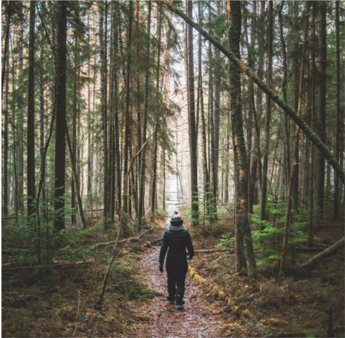
Das Saimaa-Seengebiet begeistert nicht nur mit seinen Gewässern, sondern auch den ursprünglichen Wäldern