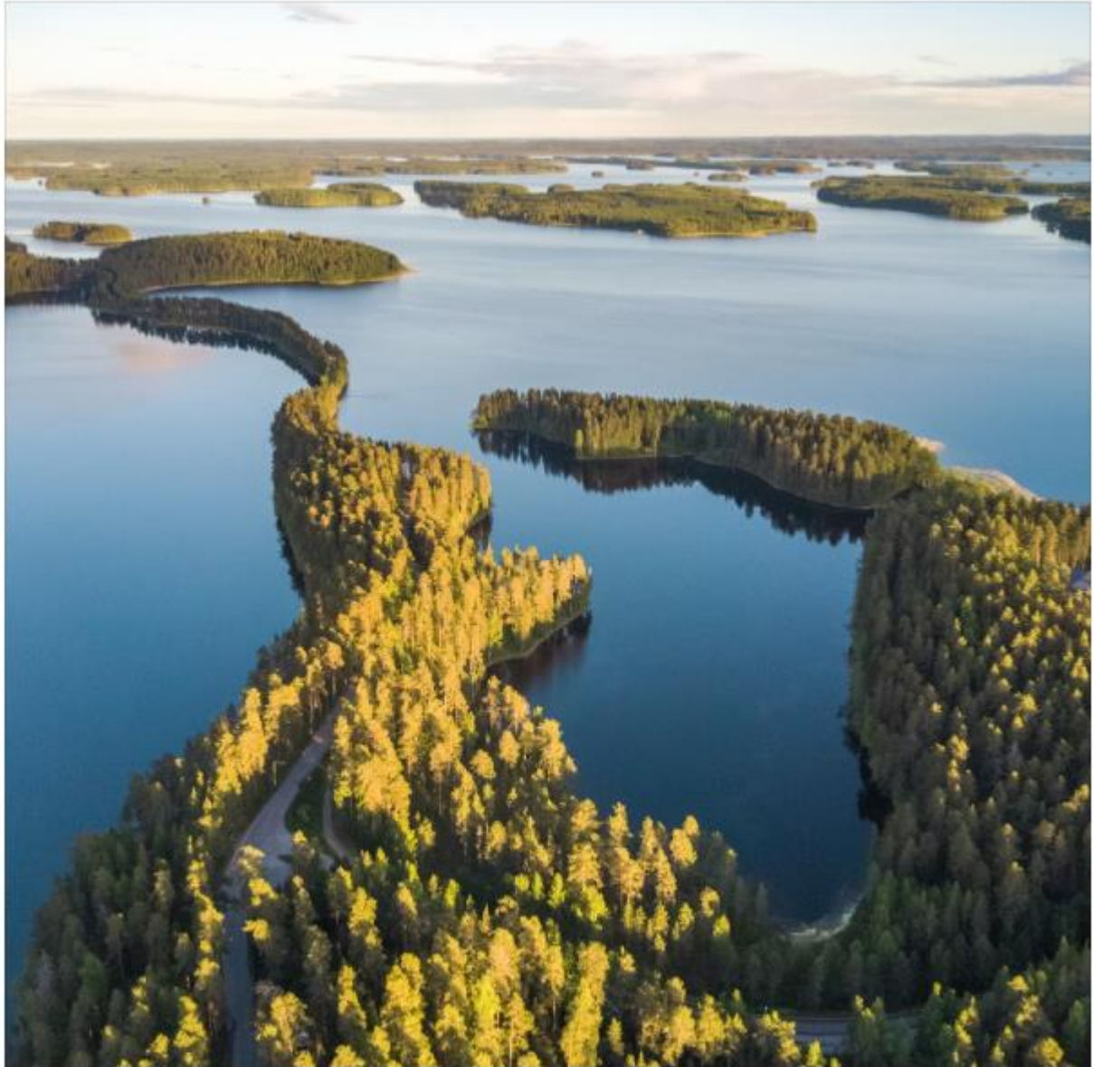
Einfach traumhaft: Punkaharju aus der Luft