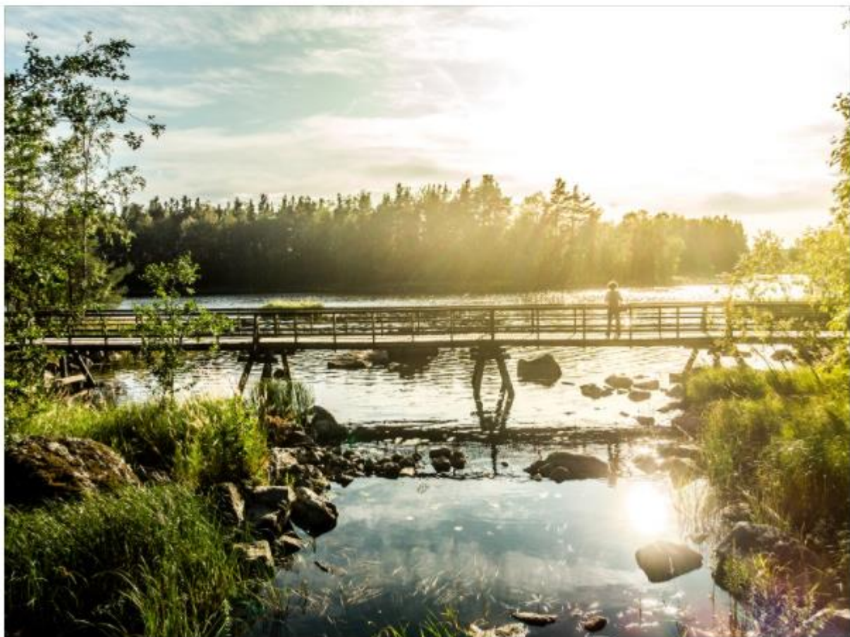
Unterwegs auf dem Naturpfad Kämäri in Varkaus