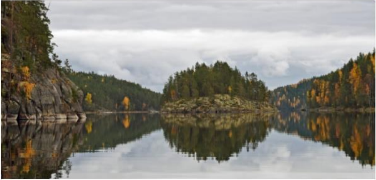
Der Nationalpark Kolovesi im herbstlichen Gewand