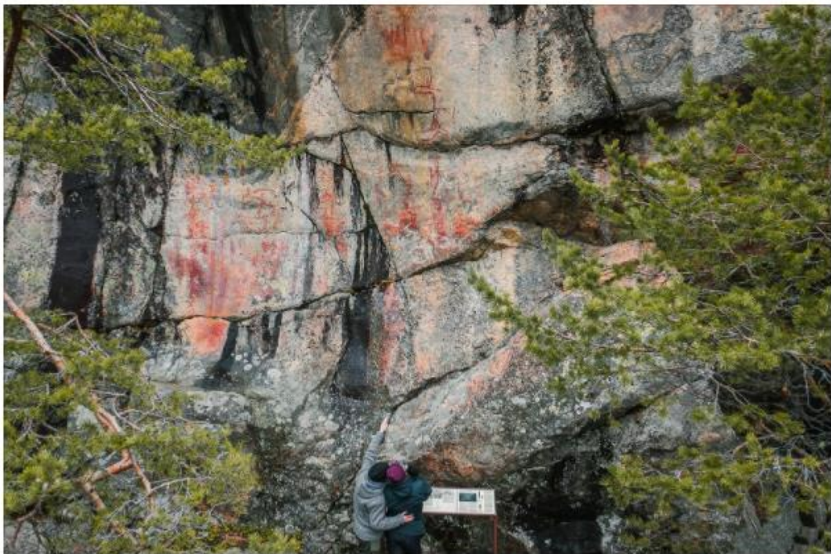
Beeindruckende Felsmalereien aus längst vergangenen Zeiten in Astuvansalmi