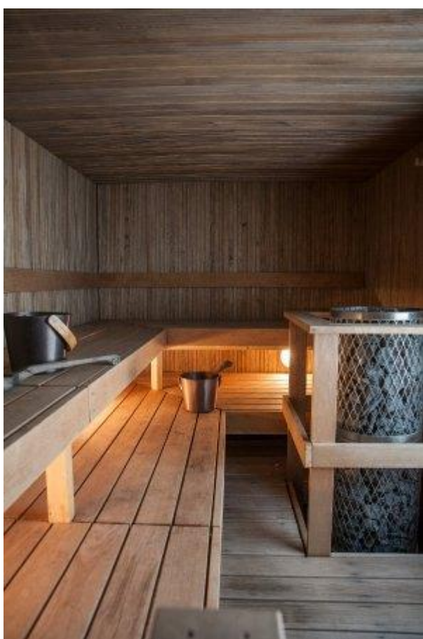
L'interno della sauna dell'Hotel Punkaharju

Vero e proprio centro benessere super-attrezzato (e con un menu di massaggi di tutto rispetto), l'area wellness dell' Hotel & Spa Resort Järvisydän è un gioiello incastonato nella roccia, letteralmente. Ricavata dentro blocchi di pietra, la Lake Spa è un tutt'uno con il prospiciente Lago Saimaa, grazie al sapiente gioco di vetrate a tutto campo che vi si affacciano. Diverse le tipologie di sauna: da quella tradizionale alla smoke sauna a quella steam. Nel centro della spa, inoltre, si trova una piscina, ideale per rinfrescarsi. Ma per i veri cultori, la tradizione si segue uscendo dalla struttura e tuffandosi nelle acque del lago.