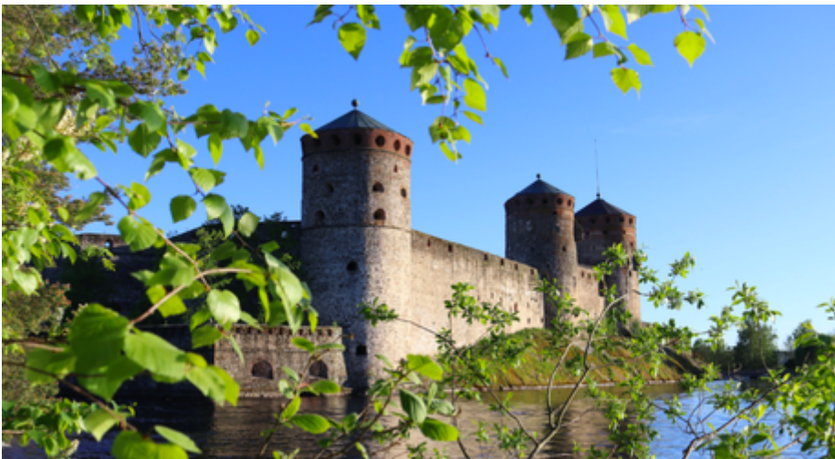
Il Castello di Olavinlinna a Savonlinna

Curiosità: Si dice (e pare proprio che sia vero) che in Finlandia ci siano così tante saune che tutte la popolazione potrebbe farla contemporaneamente. Ci sono saune praticamente ovunque: nei cottage, nelle case, nelle piscine, su autobus e barche e persino nelle biblioteche.