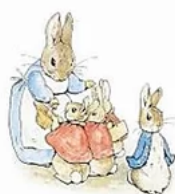
Il mondo di Beatrix Potter